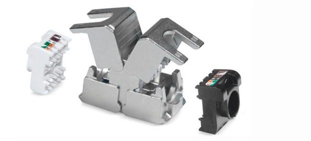
Kabelverbinder, Klasse EA, IP20