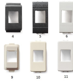
4-6 Bticino Living / Living International / Living Light 9-10 Bticino Magic / Magic TT 11 Bticino Matix