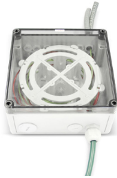
Boîte de distribution FO-DCS pour câbles FO avec faisceaux à tube lâche, type 1