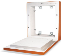
Cubierta para caja tipo Hércules AHD E30-E90