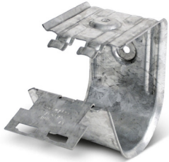
Soporte de cables múltiples E30-E90 Abrazadera tipo Hermann

distancias de fijación \leq 800 mm / \leq 600 mm