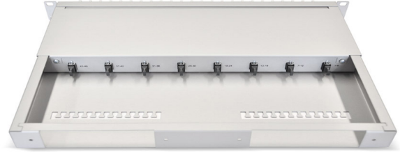
Uitzicht vanaf de achterzijde met deksel