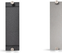
Plaque frontale partielle pour emplacement vide