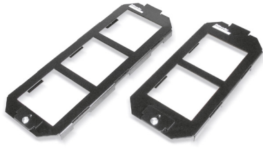
Insertos de cajas de piso para faceplates CSA Plus