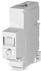
Rail adapter voor 1 RJ45 module MS-K 1/8 of MS-K Plus 1/8

voor 1 RJ45 module MS-K 1/8 of MS-K Plus 1/8