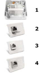
AP Anschlussdose IP44 für 2 Module zur Aufputzmontage