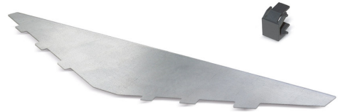
Cubierta superior para el panel de parcheo KS 24x-a, en ángulo Tapa en blanco, negro