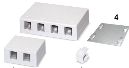
1 AP Anschlussdosen für 2, 4 oder 6 Keystone-Module mit Staubschutzklappen