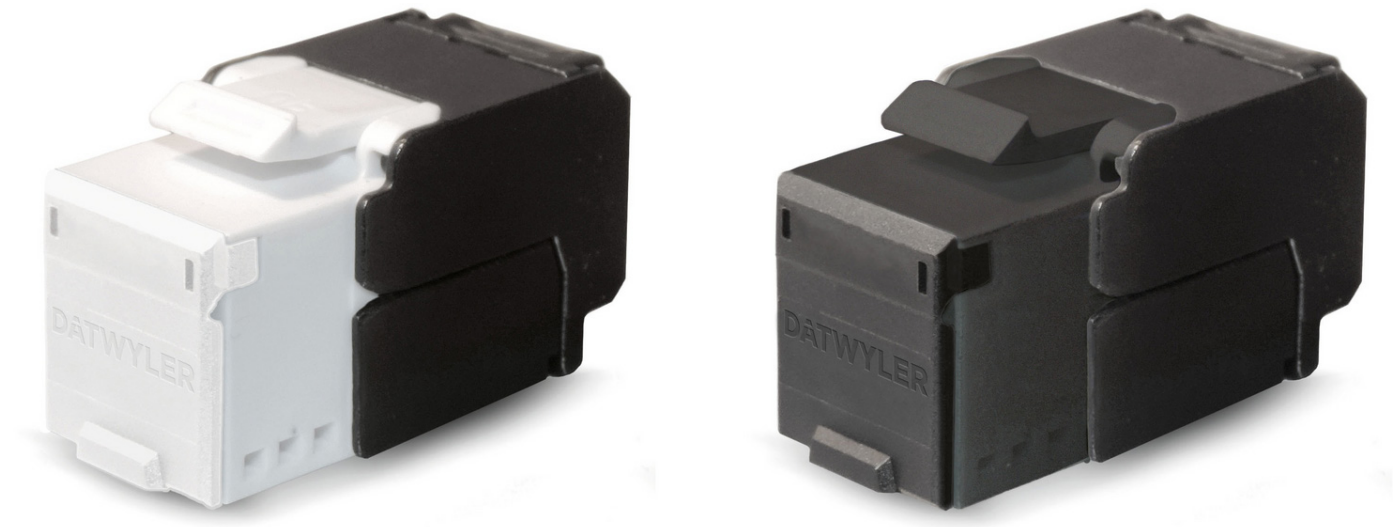
Módulo RJ45 KU-TC Plus, sin herramienta, Cat.6A (IEC), sin blindaje, con cubre polvo

Módulo RJ45, sin blindaje, Categoría 6 A (IEC)