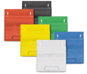
RJ45-Modul KS-T 1/8 toolless Cat. 6/EA, mit Staubschutzklappe