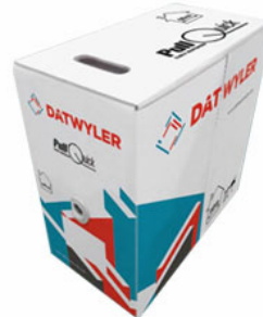
Dans une boîte PullQuick